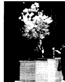
誓いの言葉 新入生代表 細川