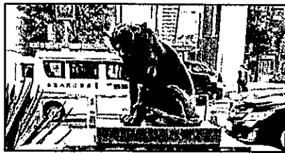
(通行人に向かって吠えるブロンズのトラ。)