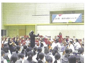
【身近な街のコンサート】