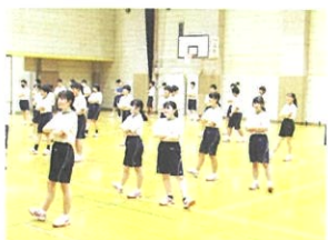
【ダンスの授業・練習】