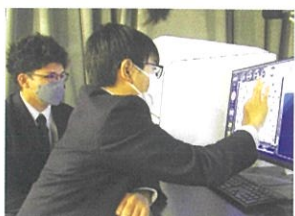
【みなと科学館と連携した実験授業】