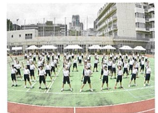
運動会（ダンスコンテスト）