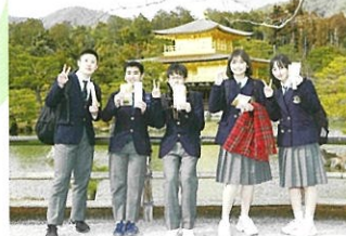
3年修学旅行（関西方面）