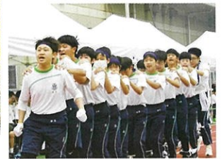
運動会（伝統のムカデ競争）