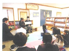
【図書委員会の活動】