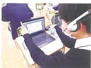
【タブレットを活用した授業】