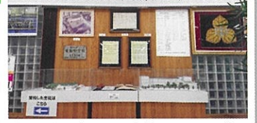
玄関に掲げている本校のスローガン

生徒の学びに向かう力を育む御成門中学校 自ら充実した学校生活を創り世界に発信する