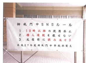
【生徒が決めたSNSルール】