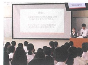
【総合的な学習の時間説明会】