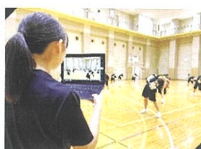
【タブレットを活用した部活動】