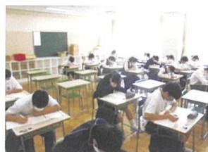
【英検・漢検・数検】