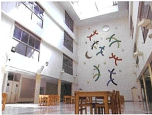
2階吹き抜け多目的ホール