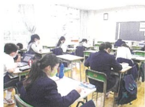
【放課後学習支援教室】